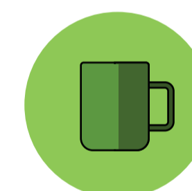
Objetos ou superfícies contaminadas