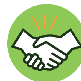
Toque ou aperto de mãos